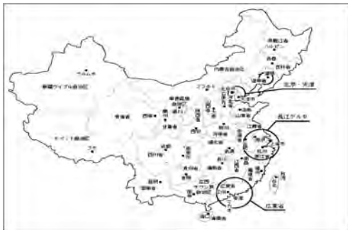
図1 東部沿海における三つの主要地域